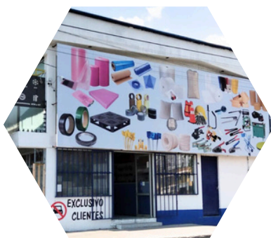
Suc. Av. Universidad