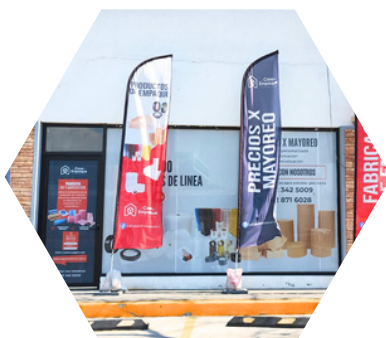
Suc. San Juan del Río