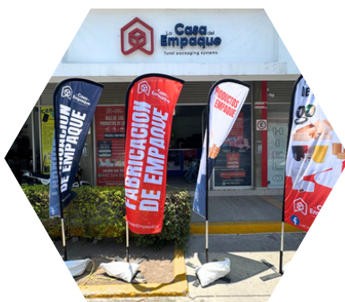
Suc. El Pueblito