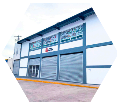
Suc. El Marqués